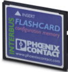
Program and configuration memory, plug-in, 256 MB

Please be informed that the data shown in this PDF Document is generated from our Online Catalog. Please find the complete data in the user's documentation. Our General Terms of Use for Downloads are valid ( http://download.phoenixcontact.com )