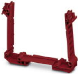
Component housing, Lower part, color: red, width: 17.5 mm, number of positions cross connector: not relevant

Please be informed that the data shown in this PDF Document is generated from our Online Catalog. Please find the complete data in the user's documentation. Our General Terms of Use for Downloads are valid ( http://phoenixcontact.com/download )