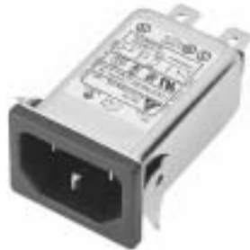
NG3QM(H) (Optional wire type)