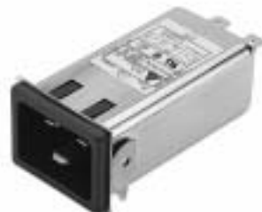
20GENG3E (Optional wire type)