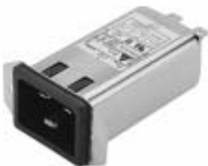
20GEEG3E (Optional wire type)