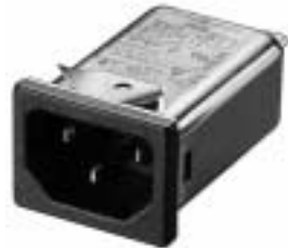
NG3QM (Optional wire type)