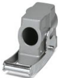
HEAVYCON B16 sleeve housing, with central locking latch, height: 56 mm, with 1 x M32 thread, lateral cable outlet

Please be informed that the data shown in this PDF Document is generated from our Online Catalog. Please find the complete data in the user's documentation. Our General Terms of Use for Downloads are valid ( http://phoenixcontact.com/download )