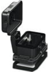
HEAVYCON EVO panel mounting base, plastic, B10, for double locking latch, height: 30.5 mm, with flat gasket, with protective cover

Please be informed that the data shown in this PDF Document is generated from our Online Catalog. Please find the complete data in the user's documentation. Our General Terms of Use for Downloads are valid ( http://download.phoenixcontact.com )