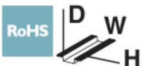
The figure shows EMG 17-REL/KSR-G 24/2E/SO38

Relay module, with soldered-in miniature switching relay, contact (AgPd60 5 µm hard gold-plated): Medium to large loads, double A2 connection, 1 PDT, input voltage 230 V AC/DC