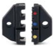
Spare die for CRIMPFOX-RCI 6

Replacement die - CRIMPFOX-RCI 6/DIE - 1212058