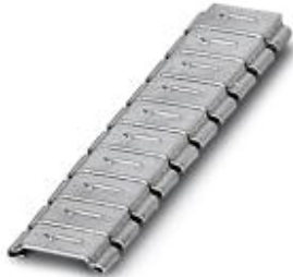
Marking collar, Labeled with the number: 7, silver, Width: 5.5 mm

Please be informed that the data shown in this PDF Document is generated from our Online Catalog. Please find the complete data in the user's documentation. Our General Terms of Use for Downloads are valid ( http://phoenixcontact.com/download )