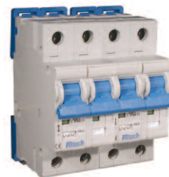
Four Pole Please contact Altech.

Non-standard current ratings available. Minimum quantities may apply. Please contact Altech for further details.