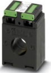
Bus-bar current transformer, 400 A AC primary current; 5 A AC secondary current; accuracy class 1; 5 VA rated power

Please be informed that the data shown in this PDF Document is generated from our Online Catalog. Please find the complete data in the user's documentation. Our General Terms of Use for Downloads are valid ( http://phoenixcontact.com/download )