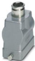
HEAVYCON sleeve housing B10, for single locking latch, height 72 mm, with screw connection 1x M25, straight conductor exit

Please be informed that the data shown in this PDF Document is generated from our Online Catalog. Please find the complete data in the user's documentation. Our General Terms of Use for Downloads are valid ( http://phoenixcontact.com/download )