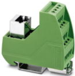
VARIOFACE module with screw connection and RJ45 connector

Please be informed that the data shown in this PDF Document is generated from our Online Catalog. Please find the complete data in the user's documentation. Our General Terms of Use for Downloads are valid ( http://phoenixcontact.com/download )