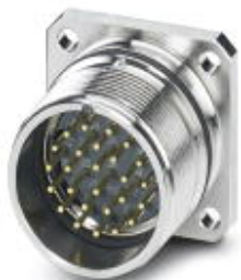
Contact carriers, M27, number of positions: 26, type of contact: Pin, Solder-in connection

Please be informed that the data shown in this PDF Document is generated from our Online Catalog. Please find the complete data in the user's documentation. Our General Terms of Use for Downloads are valid ( http://phoenixcontact.com/download )