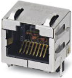
RJ45 socket insert, for PCB assembly, CAT6 A , 8-pos., shielded, with angled solder pins, 1x

Please be informed that the data shown in this PDF Document is generated from our Online Catalog. Please find the complete data in the user's documentation. Our General Terms of Use for Downloads are valid ( http://download.phoenixcontact.com )