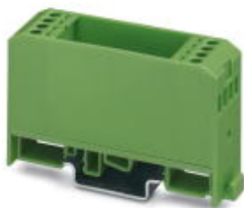
Electronic housing, with universal foot, for PCB insertion, without screw connection terminal blocks and cover

Please be informed that the data shown in this PDF Document is generated from our Online Catalog. Please find the complete data in the user's documentation. Our General Terms of Use for Downloads are valid ( http://phoenixcontact.com/download )