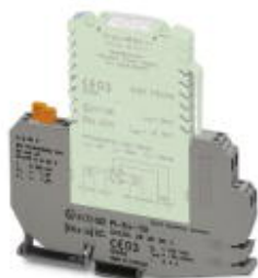
Ex base terminal block for intrinsically safe signals with knife disconnection and test connections

Please be informed that the data shown in this PDF Document is generated from our Online Catalog. Please find the complete data in the user's documentation. Our General Terms of Use for Downloads are valid ( http://phoenixcontact.com/download )