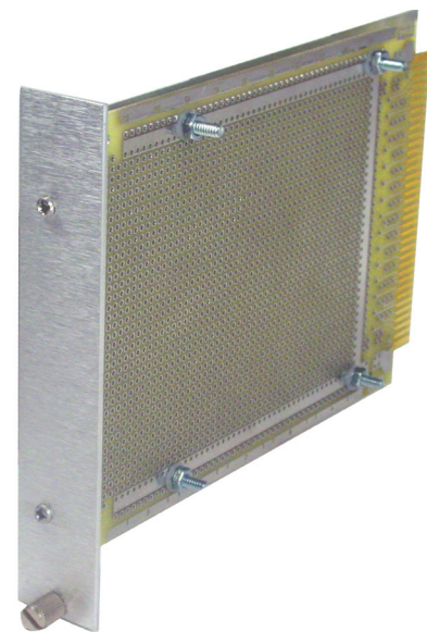
Card Mount Module Plugboard™ sold separately