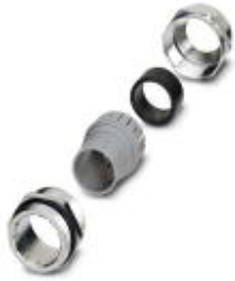
Brass screw connection, PG21

Please be informed that the data shown in this PDF Document is generated from our Online Catalog. Please find the complete data in the user's documentation. Our General Terms of Use for Downloads are valid ( http://phoenixcontact.com/download )