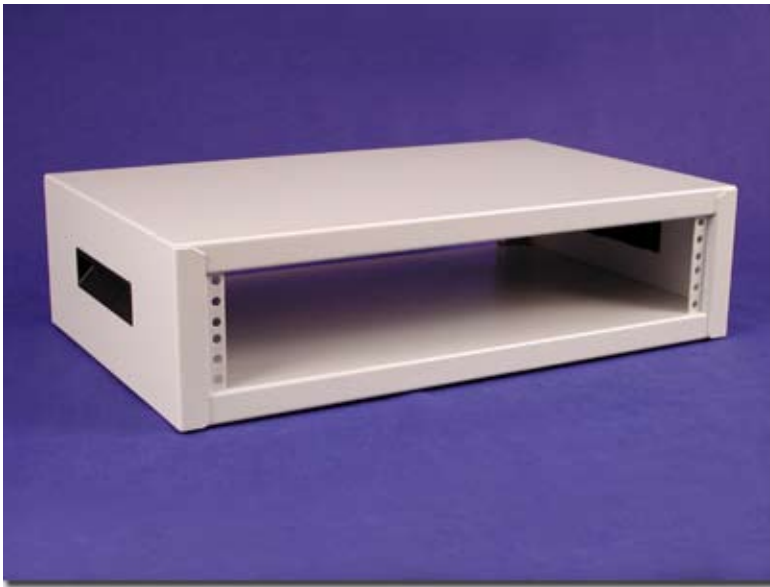
Light Gray (Textured)