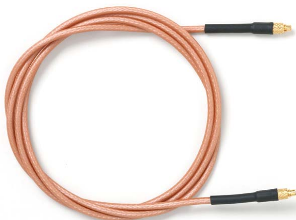
Model 73063 MMCX Plug to MMCX Plug, RG316/U

Snap-on coupling and micro-miniature size for fast connect and disconnect where space is limited