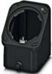
HEAVYCON EVO sleeve housing, plastic, with bayonet flange for EVO screw connection, B6, for single locking latch, height: 60.5 mm, without EVO screw connection

Please be informed that the data shown in this PDF Document is generated from our Online Catalog. Please find the complete data in the user's documentation. Our General Terms of Use for Downloads are valid ( http://download.phoenixcontact.com )