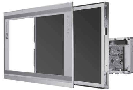
▲ Modularized design