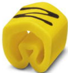
Conductor marking collar, labeled with the capital letter: Letters, yellow, width: 3.2 mm

Please be informed that the data shown in this PDF Document is generated from our Online Catalog. Please find the complete data in the user's documentation. Our General Terms of Use for Downloads are valid ( http://phoenixcontact.com/download )