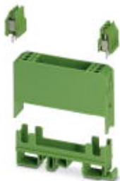
Electronic housing set, consisting of electronic housing and printed circuit termination blocks, pitch 5

Please be informed that the data shown in this PDF Document is generated from our Online Catalog. Please find the complete data in the user's documentation. Our General Terms of Use for Downloads are valid ( http://phoenixcontact.com/download )