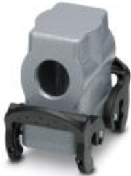
HEAVYCON sleeve housing B10, with double locking latch, height 72 mm, with thread 1x M20, lateral conductor exit

Please be informed that the data shown in this PDF Document is generated from our Online Catalog. Please find the complete data in the user's documentation. Our General Terms of Use for Downloads are valid ( http://phoenixcontact.com/download )