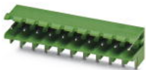
The figure shows a 10-position version of the product

PCB headers, nominal current: 12 A, number of positions: 4, pitch: 5 mm, color: blue, contact surface: Tin