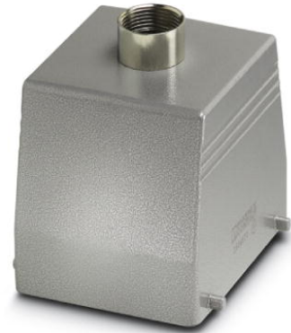
Photo shows sleeve housing with support

http://eshop.phoenixcontact.de/phoenix/treeViewClick.do?UID=1647307