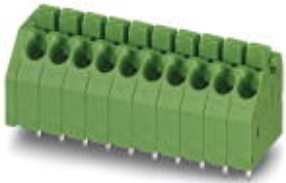
The figure shows a 10-position version of the product

Please be informed that the data shown in this PDF Document is generated from our Online Catalog. Please find the complete data in the user's documentation. Our General Terms of Use for Downloads are valid ( http://phoenixcontact.com/download )