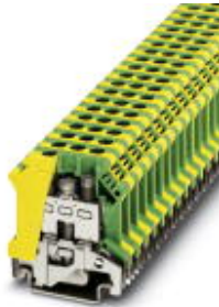
Ground terminal block with screw connection, cross section: 0.5 - 6 mm 2 , AWG: 20 - 8, width: 8.2 mm, color: green-yellow

Please be informed that the data shown in this PDF Document is generated from our Online Catalog. Please find the complete data in the user's documentation. Our General Terms of Use for Downloads are valid ( http://download.phoenixcontact.com )