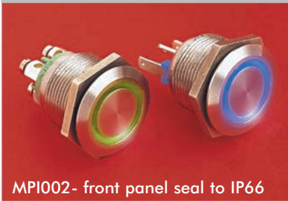
MPI002- front panel seal to IP66