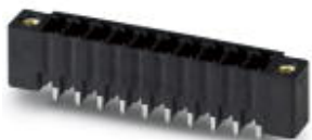
The figure shows a 10-position version of the product

PCB headers, nominal current: 8 A, number of positions: 11, pitch: 3.81 mm, color: black, contact surface: Gold, mounting: THR soldering