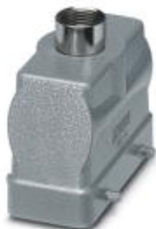
HEAVYCON B16 sleeve housing, for double locking latch, height: 65 mm, with 1 x M25 gland, straight cable outlet

Please be informed that the data shown in this PDF Document is generated from our Online Catalog. Please find the complete data in the user's documentation. Our General Terms of Use for Downloads are valid ( http://phoenixcontact.com/download )