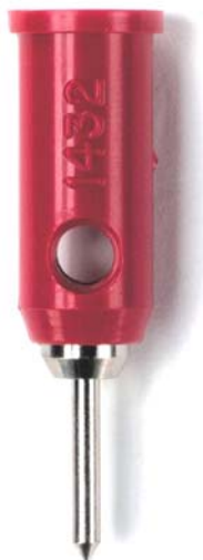
Model 1432 Banana Jack to Pin Tip Plug