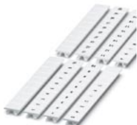
Zack marker strip, 10-section, horizontally labeled with the consecutive numbers: 101 ... 110, white, width: 8 mm

Please be informed that the data shown in this PDF Document is generated from our Online Catalog. Please find the complete data in the user's documentation. Our General Terms of Use for Downloads are valid ( http://phoenixcontact.com/download )