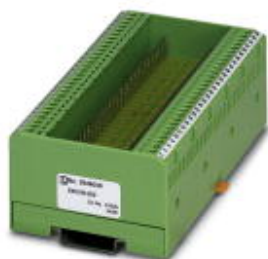
Custom circuit module, consisting of housing, MKDS 3 connection terminal blocks and PCB

Please be informed that the data shown in this PDF Document is generated from our Online Catalog. Please find the complete data in the user's documentation. Our General Terms of Use for Downloads are valid ( http://phoenixcontact.com/download )