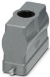
HEAVYCON B24 sleeve housing, for single locking latch, height: 76 mm, with 1 x M25 thread, straight cable outlet

Please be informed that the data shown in this PDF Document is generated from our Online Catalog. Please find the complete data in the user's documentation. Our General Terms of Use for Downloads are valid ( http://phoenixcontact.com/download )