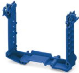
Component housing, Lower part, color: blue, width: 22.5 mm

Please be informed that the data shown in this PDF Document is generated from our Online Catalog. Please find the complete data in the user's documentation. Our General Terms of Use for Downloads are valid ( http://phoenixcontact.com/download )