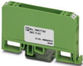
Custom circuit module, consisting of housing, MKDS 3 connection terminal blocks and PCB

Please be informed that the data shown in this PDF Document is generated from our Online Catalog. Please find the complete data in the user's documentation. Our General Terms of Use for Downloads are valid ( http://phoenixcontact.com/download )