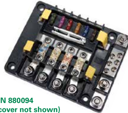
PN 880094 (cover not shown)