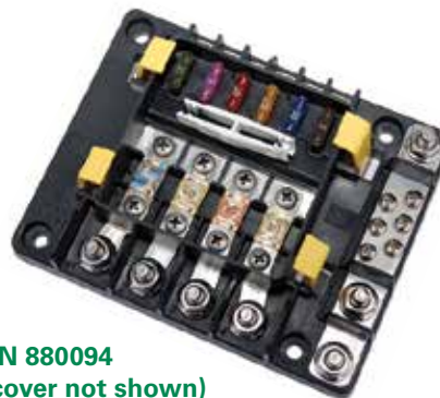
PN 880094 (cover not shown)