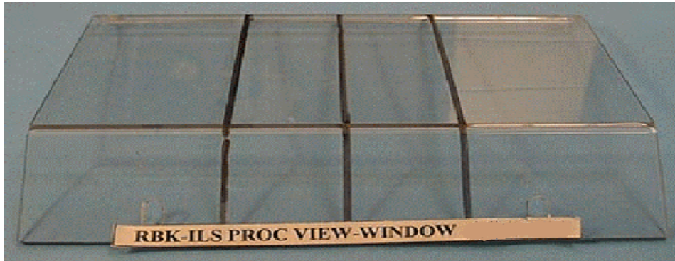
REPLACEMENT LOCKABLE COVER WINDOWS