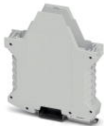
Component housing, length: 99 mm, color: light gray

Please be informed that the data shown in this PDF Document is generated from our Online Catalog. Please find the complete data in the user's documentation. Our General Terms of Use for Downloads are valid ( http://phoenixcontact.com/download )