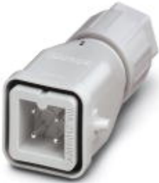
HEAVYCON QUICKON sleeve housing A3, for single locking latch, 3-pos., with PE connection, plug, QUICKON connection, straight cable outlet

Please be informed that the data shown in this PDF Document is generated from our Online Catalog. Please find the complete data in the user's documentation. Our General Terms of Use for Downloads are valid ( http://phoenixcontact.com/download )