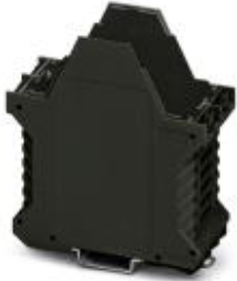
Component housing, length: 99 mm, Lower part, width: 45 mm

Please be informed that the data shown in this PDF Document is generated from our Online Catalog. Please find the complete data in the user's documentation. Our General Terms of Use for Downloads are valid ( http://phoenixcontact.com/download )