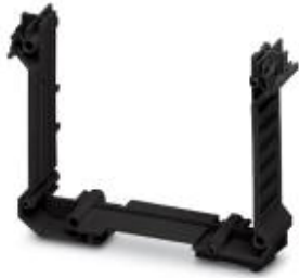
Component housing, Lower part, color: black, width: 22.5 mm

Please be informed that the data shown in this PDF Document is generated from our Online Catalog. Please find the complete data in the user's documentation. Our General Terms of Use for Downloads are valid ( http://phoenixcontact.com/download )