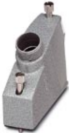
Metal sleeve housing, powder-coating, locking screws with knurled head, type 4, cable screw connection Pg21

Please be informed that the data shown in this PDF Document is generated from our Online Catalog. Please find the complete data in the user's documentation. Our General Terms of Use for Downloads are valid ( http://phoenixcontact.com/download )