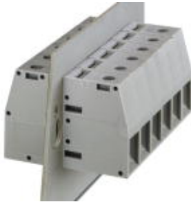
The illustration shows version HDFK 50 in gray

Please be informed that the data shown in this PDF Document is generated from our Online Catalog. Please find the complete data in the user's documentation. Our General Terms of Use for Downloads are valid ( http://download.phoenixcontact.com )