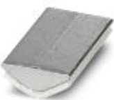
Insertion profile, Color: silver