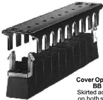
Cover Options BB Skirted access on both sides.